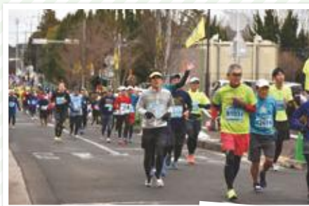
フィニッシュは 目の前… あとひといき!!