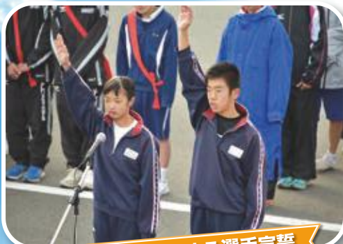
平磯中学校生徒による選手宣誓