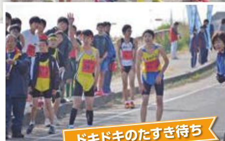
ドキドキのたすき待ち