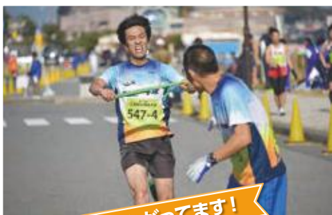
たすきつながってます!