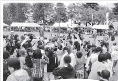
雨にも負けず、選手、スタッフともに心に残る運動会ができました。水はけのよいグラウンドにかんしゃです。