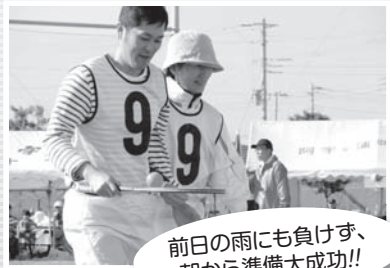
前日の雨にも負けず、朝から準備大成功!!