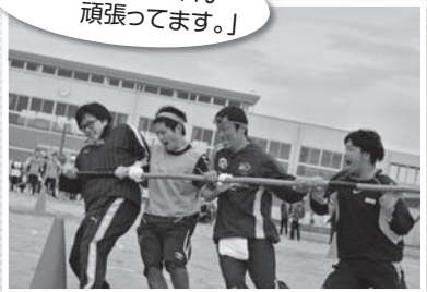
「父ちゃん・母ちゃん頑張ってます。」

お蔭で賞を いただくこ とができ と、心から 感謝を申し 上げます。 これからも 地域のため に微力です が尽くして いきたいと 思います。