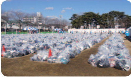
荷物預かり所風景

昨年三月から、各関係者の方々にアンケートを配布し、十二月末頃まで集計したデータの分析を実施しました。大会役員にも協力を依頼し、また、他のマラソン大会等も参考にしながら改革案をまとめてまいりました。今年の改革のメインは、ゼッケン番号の末尾0～9の列にセルフシステム(選