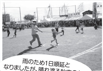
雨のため1日順延となりましたが、晴れ渡る秋空のもと熱戦が繰り広げられました。