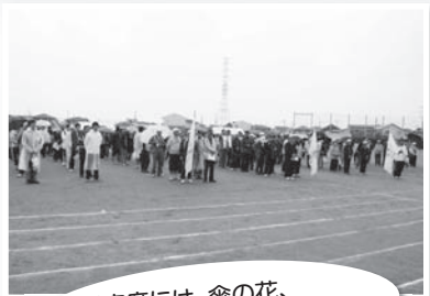
「観客席には、傘の花、小雨に負けず頑張った。」