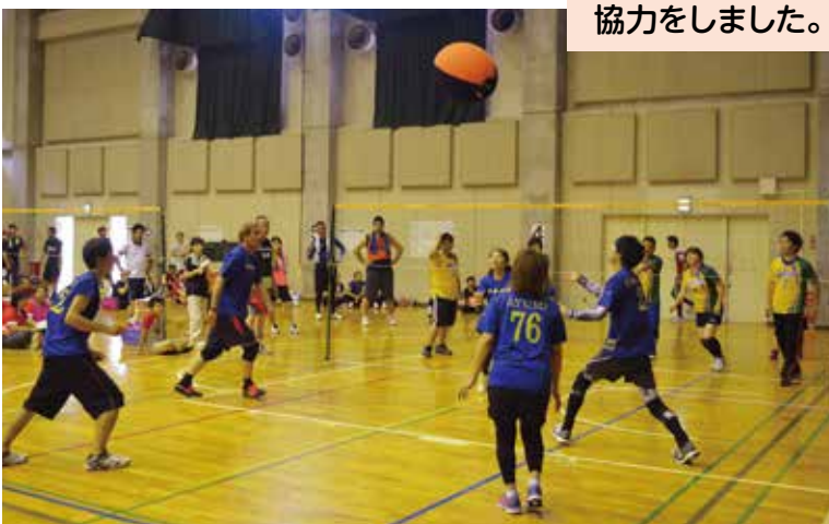
レクリエーションの部 優勝 枝川ガナールB