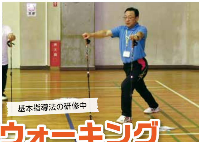
基本指導法の研修中