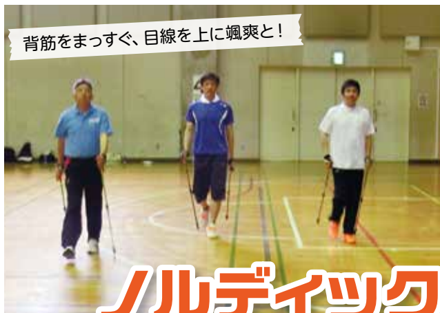
背筋をまっすぐ、目線を上に颯爽と!