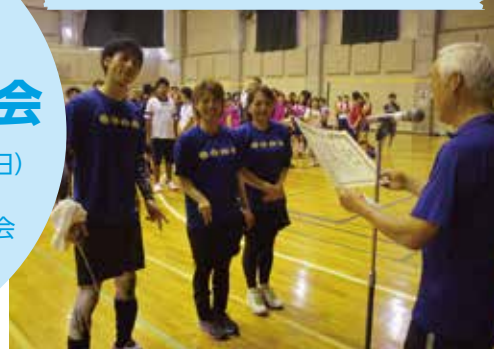
競技の部 準優勝 team足崎カボちゃんズ