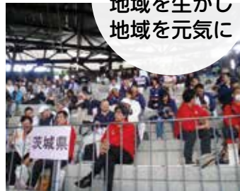
競技の部 優勝 ユニコーン