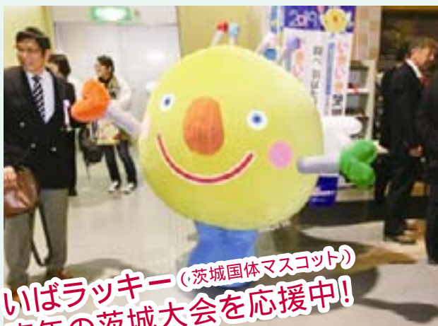
いぱラッキー (茨城国体マスコット) 来年の茨城大会を応援中!