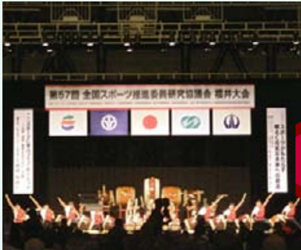
↓ 歓迎アトラクションの様子 (地元の高校生による和太鼓演奏)