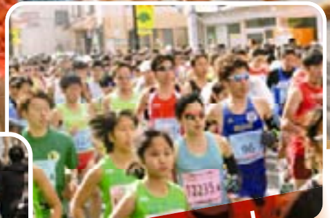
一斉スタート さあ!いくぞー!