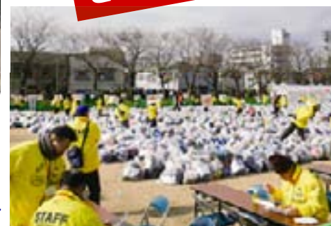
荷物の山、山、山... 今年もがんばり無事終了