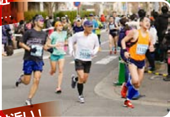
ゴールは近い! あとひとふんばり