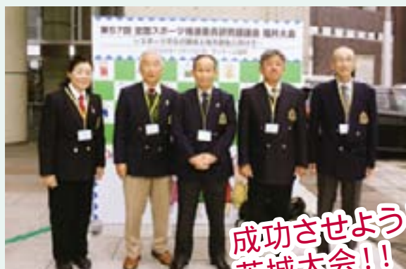
成功させよう! 茨城大会!!