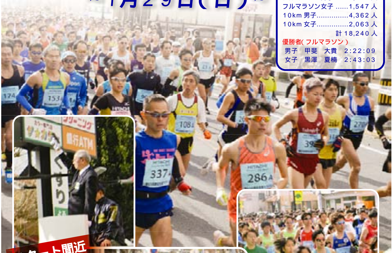
スタート間近 緊張の一瞬...