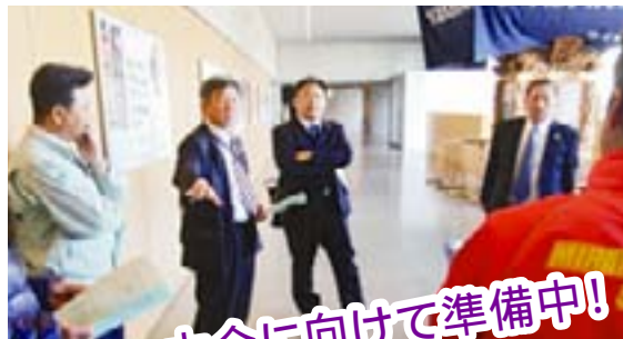
大会に向けて準備中!