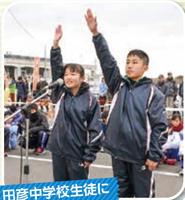
田彦中学校生徒による選手宣誓