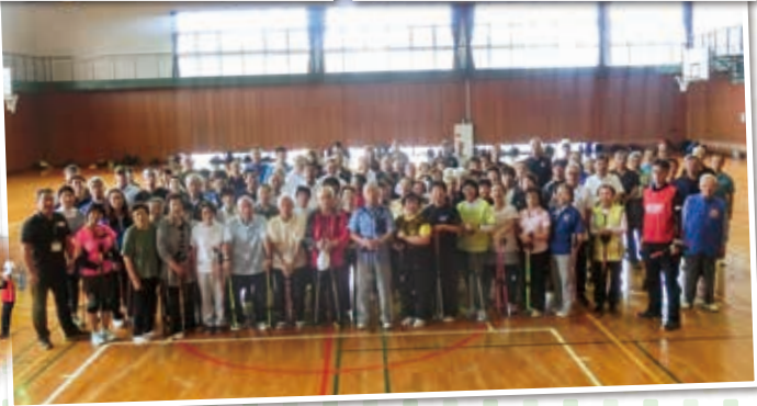
講演会・体験会の様子 皆さん真剣です。