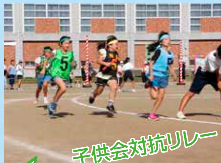
子供会対抗リレー