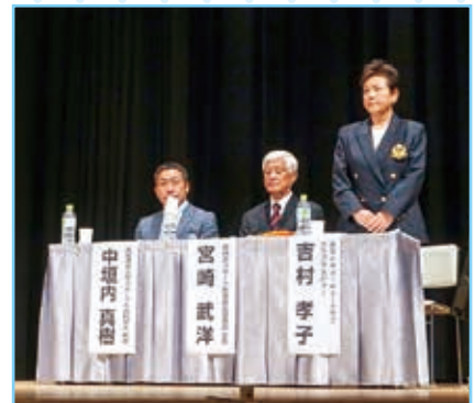
吉村氏全国大会で発表!!