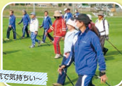
良い天気で気持ちい~