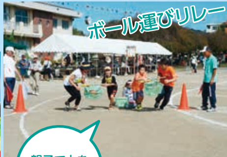
ボール運びリレー