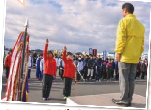
かわいい選手宣誓