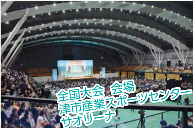
全国大会 会場 津市産業スポーツセンター サオリーナ