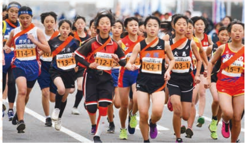
女子も 頑張ります。