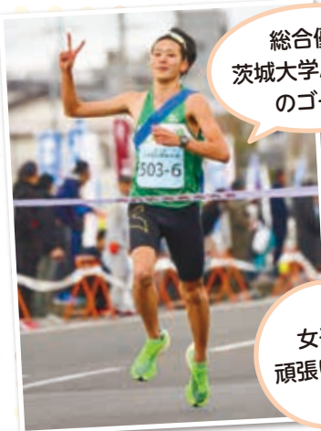
総合優勝 茨城大学Aチーム のゴール