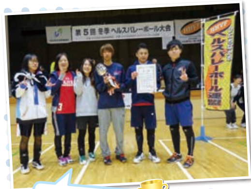
優勝のアジックスA