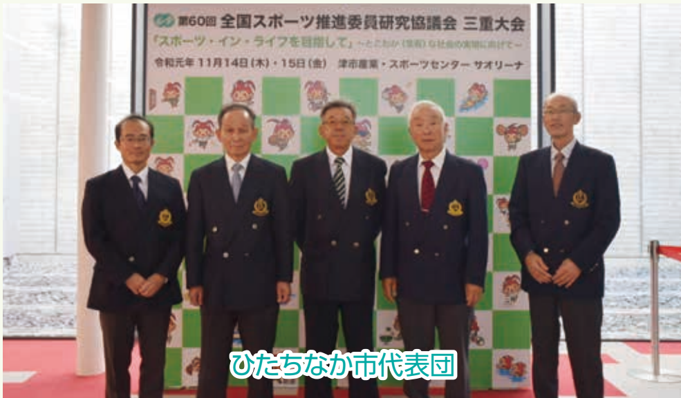
ひたちなか市代表团