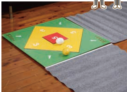
※写真は2チーム用です。