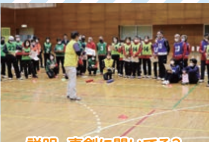
説明, 真剣に聞いている?