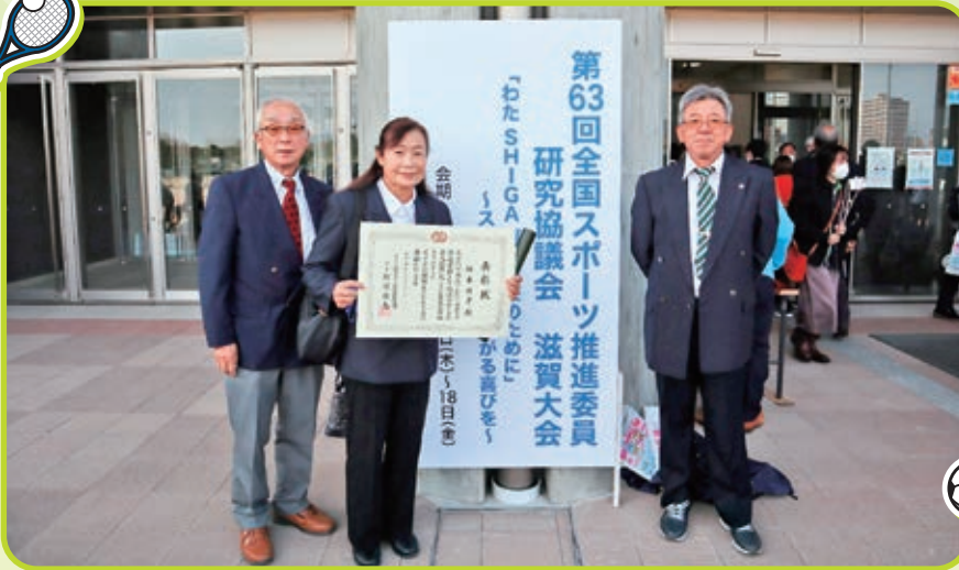
功労者表彰受賞 三役で参加