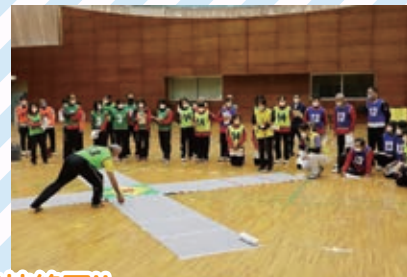
意外と難しい。慣れたころには競技終了!!