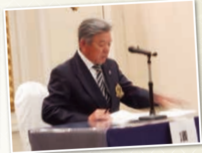
小池委員長あいさつ