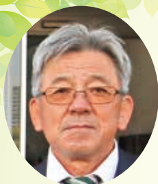
スポーツ推進委員長