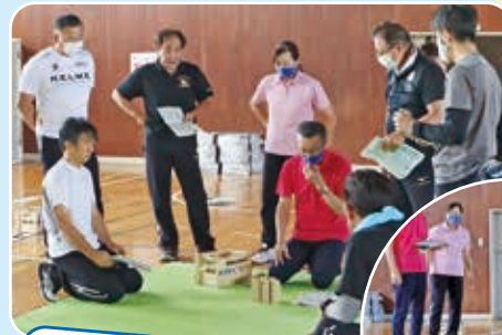
世界大会めざして!!